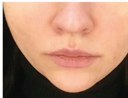
Фото 1. Пациентка С., 36 лет, с усталым морфотипом старения кожи (гравитационныйптоз 1 степени): а — до, б — через 14 дней после проведения тредлифтинга нитями Mint Lift.