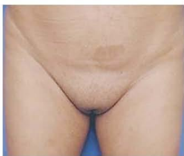
Фото 2. а