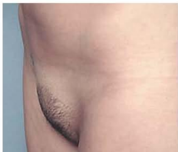
Фото 1. а