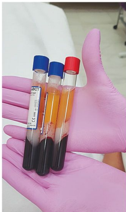
Фото 3. «После забора крови мне инъекцировали обогащенную тромбоцитами плазму и фибриновый аутогель в разные участки кожи лица и шеи».