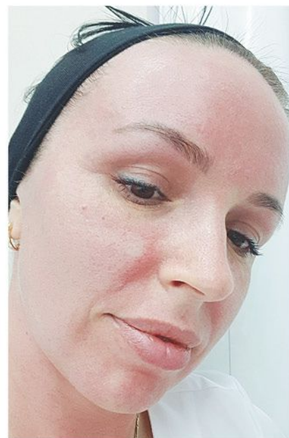
Фото 1а, 1б. «Обработку всего лица и шеи с помощью фракционного смус-омоложения я перенесла абсолютно комфортно».